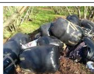
Napoli, task force dei vigili contro i rifiuti: raffica di