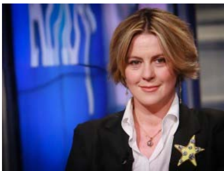
in foto: Beatrice Lorenzin